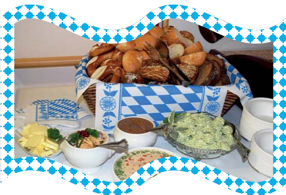
Danke an Küche und Service für das tolle Essen sowie für die Unterstützung zum Gelingen der Feier!