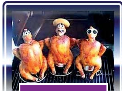
„Die drei Hähnchen vom Grill“

Wie jedes Jahr gab es wieder einen Hähnchenwagen mit reichlich Auswahl verschiedener Fleischvariationen und Beilagen.